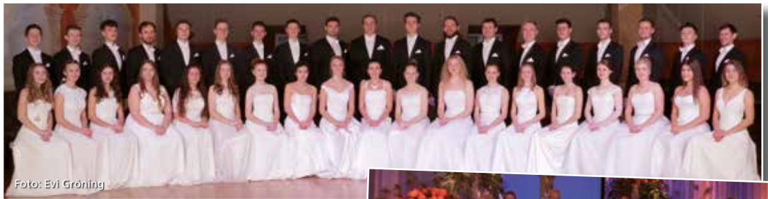
Die 19 Debütantenpaare, ausgebildet von der Tanzschule Kesmarki, eröffnen den Ball.