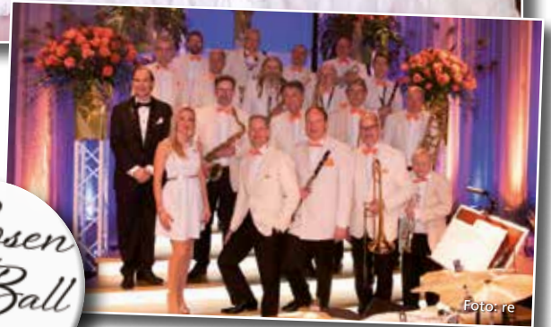
Das Markenzeichen des Orchester Hugo Strasser ist die einzigartige Mischung von Swing-Klassikern mit modernen Titeln aus Rock'n Roll und Soul sowie Pop. Feinste Big-Band-Musik in stilistischer Perfektion und das stets im strikten Tanzrhythmus.