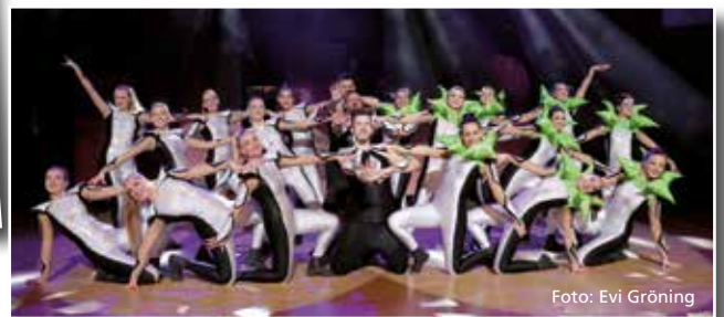
Die Faschingsgilde Rosenheim mit ihrer Show in 2020