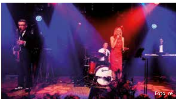
Beste Stimmung und Tanzmusik im Saal Rosenheim garantiert die Band up to date aus München.