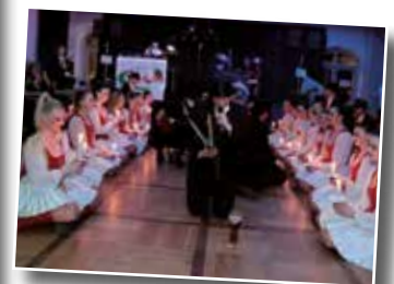
Fotoimpressionen vom Faschingsdienstag auf dem Max-Josefs-Platz und dem Kehraus beim Gasthof Höhensteiger.