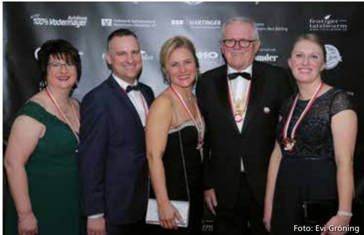
Einen vergnüglichen Abend auf dem Ball verbrachte die gesamte WV Belegschaft.