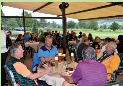
Final-Teilnehmer im Golfclub Ellmau