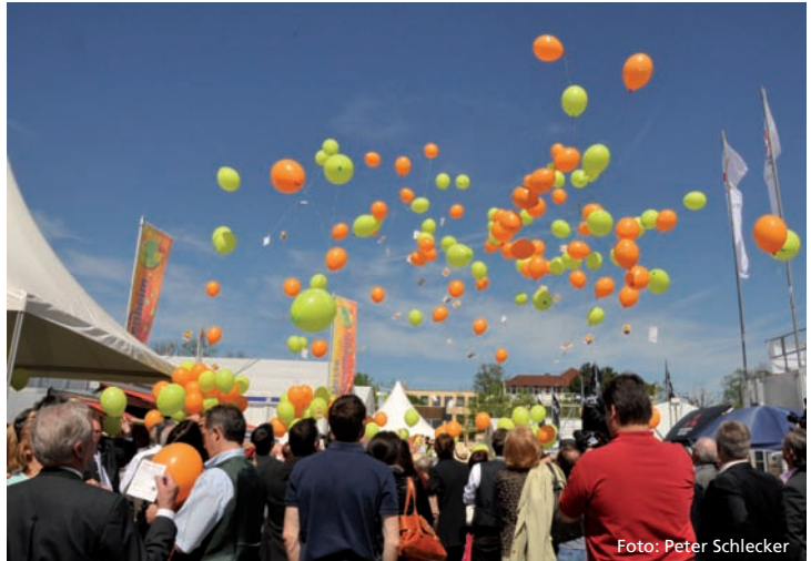
Messe Rosenheim 2015

Anmeldung: bitte per E-Mail an: (ph@wirt- schaftlicher-verband.de) oder Fax: 08031 90061 20