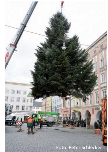
Der Christbaum beim „Landeanflug“ auf dem Max-Josefs-Platz

reiches Rahmenprogramm mit circa 70 Bühnenprogramm- punkten, dem liebevollen Märchenumzug der Kindergartenkinder aus Stadt und Land zum Auftakt, dem beliebten Nikolausauftritt, das abwechslungsreiche Kasperltheater an den Familientagen sowie die große WV Wiggerlverlosung konnten auch 2016 wieder den niveauvollen Gesamtauftritt des mit diesmal 30 Tagen sehr langen Christkindlmarktes bestätigen. An allen vier Adventssamstagen fuhr der so genannte Adventsbus kostenlos auf allen Linien des Stadtverkehrs und wurde noch ergänzt