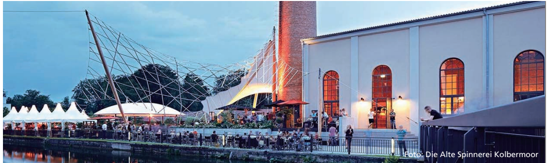
Die Alte Spinnerei in Kolbermoor

Quest AG lädt Mitglieder in Alte Spinnerei Kolbermoor ein – Vortrag: Vitalität 2.0 – Individuelles Gesundheitsmanagement