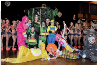
Gewinner Kostümwettbewerb

1300 kleine und große Narren feiern in der Inntalhalle