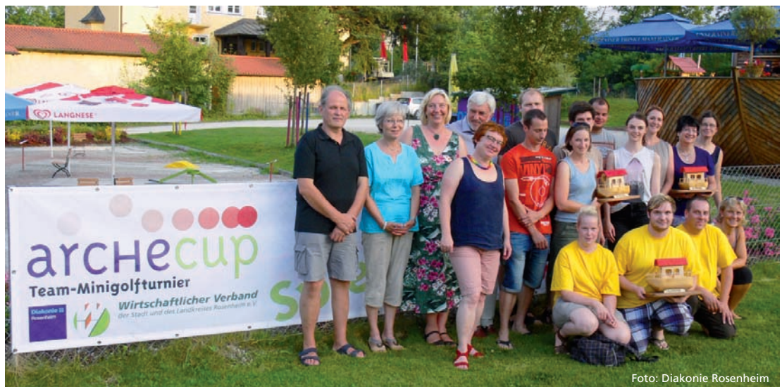
Das Team vom archecup 2015

am 8. Juli um 18:00 Uhr zu Gunsten des Ehrenamts: soziales Engagement mit Spiel, Spaß und Spannung!